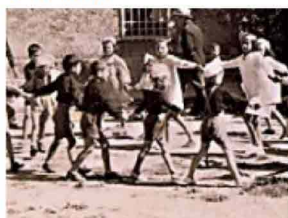
Strage di Sant'Anna di Stazzema: 5 cose da sapere