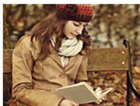
5 libri per l'autunno