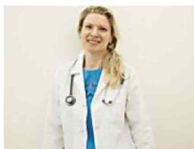
Mangiare bene per sconfiggere il male