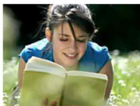
5 libri da leggere a settembre