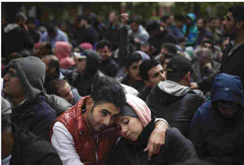
A sinistra, rifugiati e migranti in fila per essere registrati come richiedenti asilo a Berlino

evolutiva del genere Homo , dove si rintraccia la base naturalistica, comune a tutti gli organismi viventi, di reagire agli stress fisici e biologici spostandosi in altri territori, inseguendo le catene alimentari e le modifiche degli habitat. E qui il primo nodo che la storia ci restituisce. Una specie, la nostra, che grazie al migrare ha saputo rispondere alle mutate condizioni esterne ed evitare l'estinzione, ma che si proietta nella storia come l'essere stanziale per definizione. La stanzialità è stata ritenuta la costante della condizione umana, contrapposta all'eccezionalità dell'erranza, propria degli animali. E sulla stanzialità si fonda la superiorità dell'uomo che "per diritto ancestrale" si sente proprietario della terra che abita, con cui instaura un vincolo di sangue, alla base delle ideologie dell'appartenenza e dell'identità nazionalistica. E proprio questo tema dell'appartenenza è oggi di grande attualità, al centro della urgente riflessione sulla riforma della legge di cittadinanza, che al momento esclude dall'accesso ai diritti una fetta consistente di abitanti di un territorio, solo perché stranieri, escludendoli così dall'elementare esercizio della democrazia: il suffragio universale!