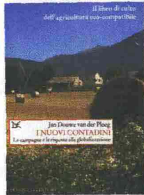
Jan Douwe van der Ploeg I NUOVI CONTADINI Le campagne e le risposte alla globalizzazione Donzelli Editore, Roma, 2009 (pp. X + 408, ill., € 39,50)

Chi è il contadino del terzo millennio? Come agisce e che funzione ricopre nell'agricoltura mondiale? A questa e ad altre domande vuole rispondere questo libro di Jan Douwe van der Ploeg, docente di Sociologia rurale all'Università di Wageningen nei Paesi Bassi, proponendo al lettore una