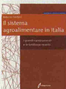
Roberto Fanfani , Edagricole, Milano, 2009 (pp. XVI + 252, € 25,00)

L'agricoltura italiana dal secondo dopoguerra al nuovo millennio, l'industria agroalimentare italiana e la sua collocazione in Europa, le nuove tendenze del commercio e dei consumi alimentari. Sono i temi che Roberto Fanfani affronta in questo volume, per offrire un'analisi il più possibile esaustiva del sistema agroalimentare italiano. Gli approfondimenti e i contenuti sono rivolti, in particolare, a soddisfare le esigenze degli operatori del settore interessati ad approfondire la conoscenza delle diverse componenti del sistema agroalimentare e delle loro interrelazioni, così come si sono venute evolvendo nel tempo.