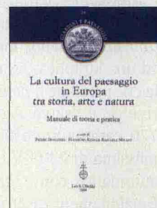
A cura di Pierre Donadieu , Hansjorg Kuster , Raffaele Milani Leo S. Olschki, 2008 (pp. XII + 194, € 18,00)

Il tutto mirando sempre ad un equilibrio tra innovazione e conservazione. A questo proposito - avverte uno dei curatori - «in un momento nel quale le risorse dell'ambiente e la qualità del territorio sembrano fortemente minacciate, il paesaggio che le comprende può diventare un luogo di alta progettualità, portando finalmente il seme di una buona relazione tra modernità e tradizione». ■