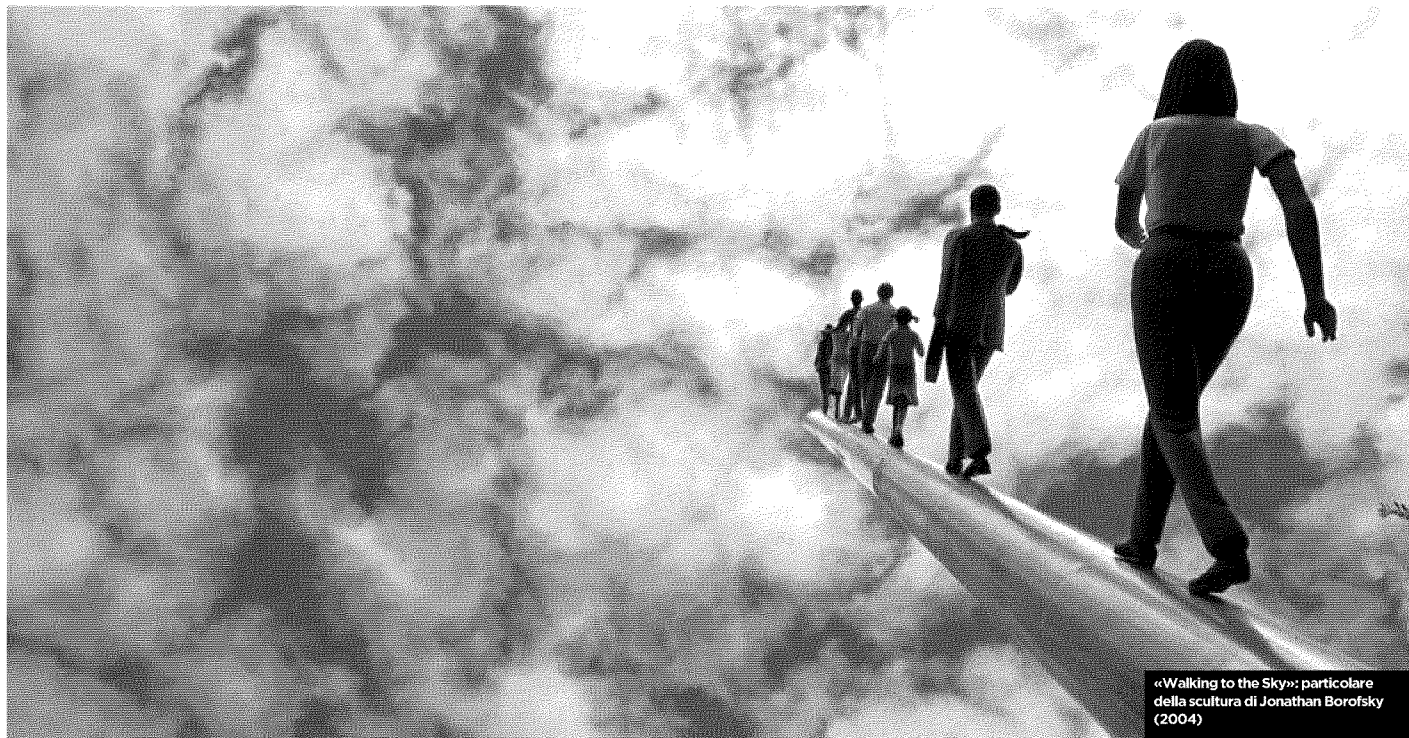
«Walking to the Sky»: particolare della scultura di Jonathan Borofsky (2004)