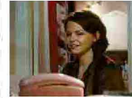
Clancy Martin e le bugie in amore: perché mentiamo (anche a noi stessi)