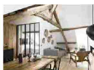
SU LIVING Una mansarda di 50 mq a Parigi