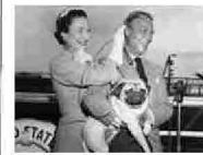
Grandi amori Royal

Over racconta l'amore tormentato tra Cher e Hunter. «La protagonista deve fare i conti con un passato difficile, per disegnarla mi sono basata anche sulle mie paure» confessa l'autrice, la cui storia è cresciuta con lei, sulle pagine digitali di Wattpad, avviata quando aveva 14 anni. «Nella community si trovano molti