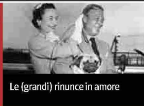
Le (grandi) rinunce in amore

Inchieste, parole, pensieri, opinioni. Le cose della vita