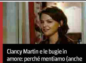
Clancy Martin e le bugie in amore: perché mentiamo (anche