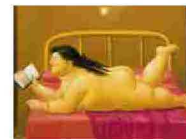
Sapiosessuali, brividi d'intelletto Quando il feeling è (anche) smart