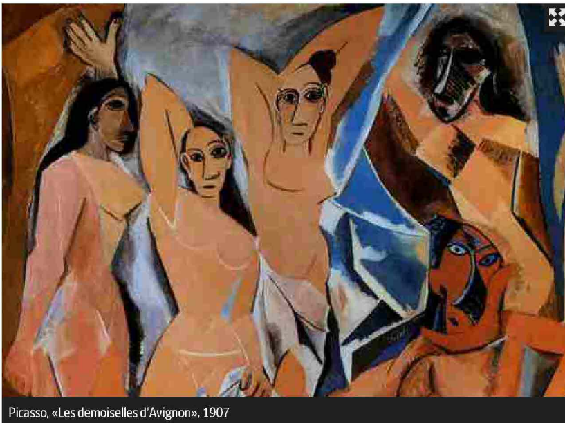
Picasso, «Les demoiselles d'Avignon», 1907

Giovanissime, sesso e scrittura. Dopo il successo internazionale di E. L. James —