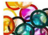
Lo usa solo un uomo su cinque L'estinzione del condom (anche in tv)