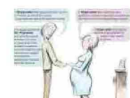
Desiderio e gravidanza: ecco perché è giusto farlo. Se l'astinenza è l'anticamera del matrimonio bianco