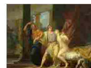
La bisessualità e i greci: nessuna libertà, regole precise e concessa solo agli uomini