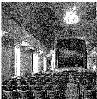
Sopra ancora una veduta del teatrino di Villa Raggio. A sinistra il Teatro del Convitto Nazionale Maria Luigia di Parma. A destra la copertina del volume edito da Franco Angeli (foto Carlvero - Teatri Aperti, dal volume "Teatri negati")