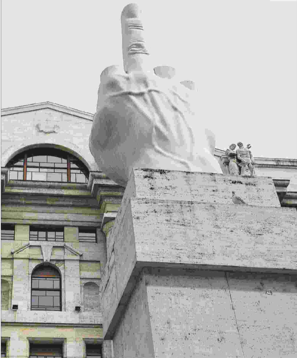
La società di consulenza Equita include fra gli elementi di progresso delle imprese italiane lo "sviluppo di canali di finanziamento alternativi alle banche"

Ritaglio stampa ad uso esclusivo del destinatario, non riproducibile.