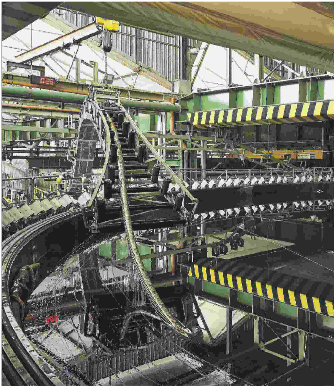
Uno stabilimento di Prysmian Group, che ha sede a Milano ed è leader mondiale nella produzione di cavi

Ritaglio stampa ad uso esclusivo del destinatario, non riproducibile.