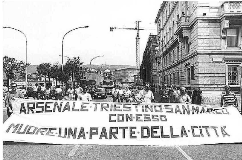
In alto la "Raffaello", uno dei gioielli della marineria italiana usciti dal cantiere San Marco. Qui accanto, un momento della protesta degli operai dell'Arsenale triestino del 1993