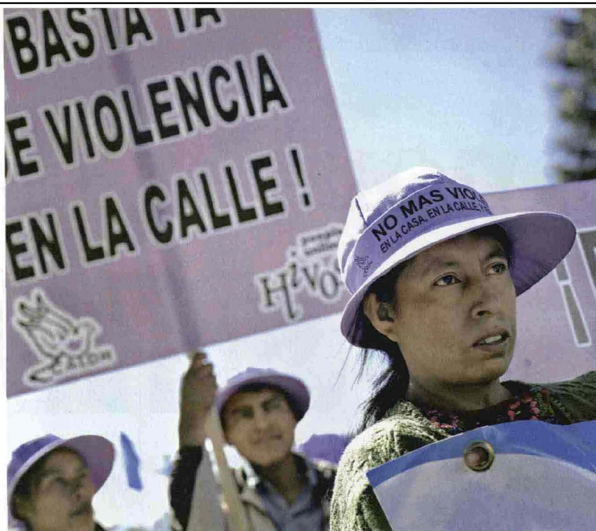
Guatemala, 25 novembre 2008, manifestazione contro la violenza sulle donne