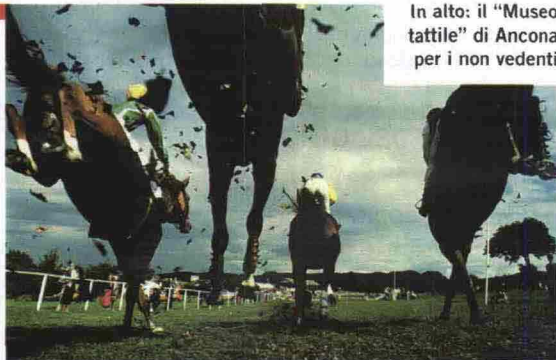
In alto: il "Museo tattile" di Ancona per i non vedenti