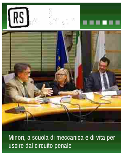
Minori, a scuola di meccanica e di vita per uscire dal circuito penale

Sono stati intervistati 2.376 dei 5797 volontari Expo . Il 66% è donna, il 91,5% è laureata o diplomata. Poco schierata politicamente: circa il 50% non ha risposto alla domanda sul proprio orientamento politico, mentre il 19% dice di essere di centro sinistra, il 10% di sinistra e l'8,5% di centro destra. Il 46% ha comunque espresso un atteggiamento non partecipativo nei confronti della politica, solo il 2,5% si considera politicamente impegnato e il 25,5% si tiene al corrente e vorrebbe poter dare un suo contributo positivo per migliorarla. A ciò si aggiunge un 22% di volontari che dichiara di avere un atteggiamento politico di forte distacco e si colloca o nella categoria "Non la seguo, non mi interessa" (12%) o nella categoria "Mi disgusta" (10%). Sono anche poco religiosi: il 38% pratica saltuariamente (per esempio solo in occasioni particolari o per le