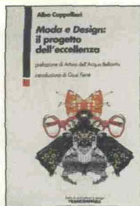
Alba Cappellieri, Moda e Design: il progetto dell'eccellenza , FrancoAngeli, Milano 2007, pp. 153, euro 19,50.