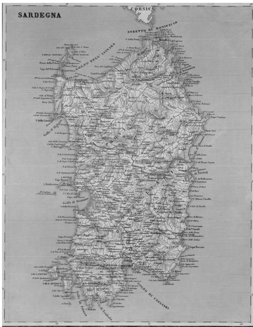
Fig. 1 – La Sardegna nel 1860 http://www.sardegnaigitallibrary.it/index.php?xsl=626&s=17&v=9&c=4461&id=13206