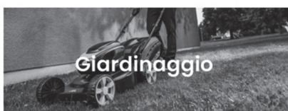
Fig. 2 – La pagina di categoria di Brigros

E qui, se il nostro cliente è un principiante, avrà qualche incertezza: il trapano a batteria si troverà tra gli “Elettrodomestici” o tra gli “Utensili manuali”?